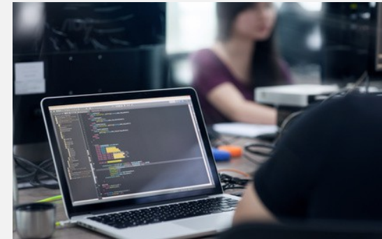
.telyou research & development