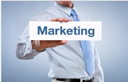
.telyou marketing & sales (VWE)